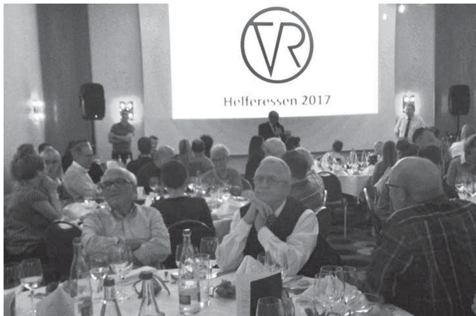
Am 4. November 2017 fand im Radisson blu Hotel in Basel ein grosser Helfer- anlass des TVR statt – zum ersten Mal in dieser Form.