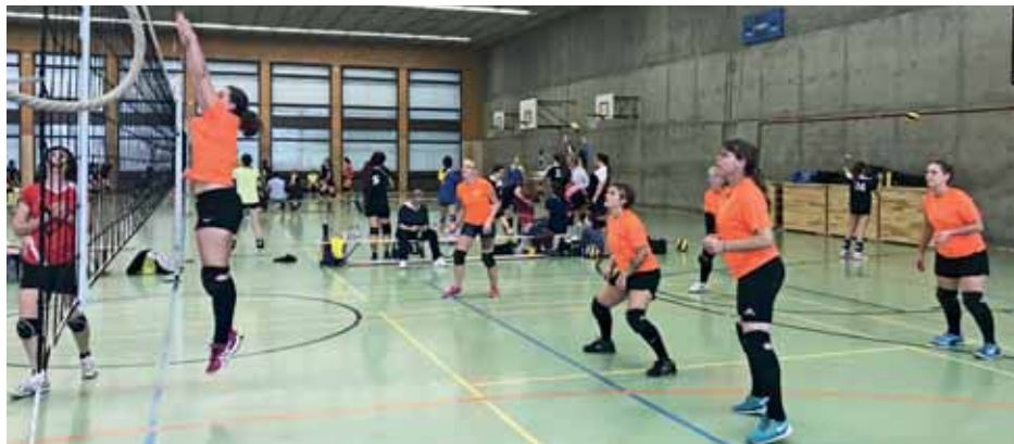
Das VBTVR-Team an einem Turnierspiel in der Sporthalle Bäumlihof.

Mit 19 gemeldeten Teams durften sich die Volleyballerinnen des TV Riehen an ihrem Hallenturnier vom Sonntag, 22. Oktober, über eine ausserordentlich gute Beteiligung freuen. Gespielt wurde in der Sporthalle Bäumlihof in drei Kategorien: Damen 3./4. Liga (7 Teams), Damen Plausch Easy League und 5. Liga (6 Teams) und Mixed (6 Teams). Bei den Frauen 3./4. Liga und in der Mixed-Konkurrenz wurde es um den Turniersieg sehr spannend. In beiden Kategorien waren die beiden besten Teams am Ende punktgleich und es entschied das jeweils höhere Total der insgesamt erzielten Spielpunkte – bei den Damen für den TV Arlesheim und bei den Mixed für «Starfield».