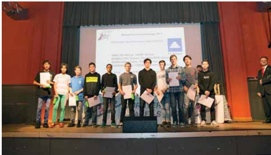
TVR-Nachwuchssportler auf der Bühne an der DV des Turnverbandes.

An der Delegiertenversammlung des Turnverbandes Basel-Stadt vom 17. November wurde der Vorstand aufgestockt – und der TVR vielfach geehrt.