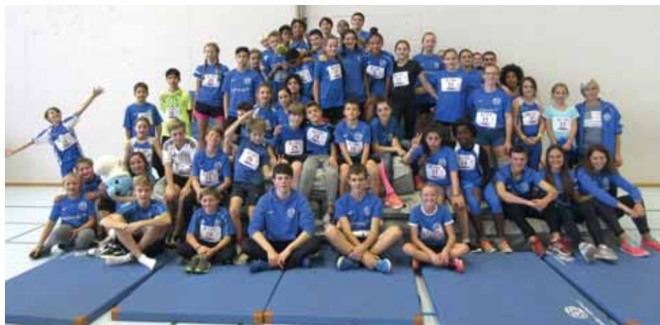
Alle TVR-Teammitglieder der Altersklassen U14 und U16 beim Gruppenfoto in der Sporthalle Hagenbuchen in Arlesheim.

Fünf TVR-Teams haben sich an der Lokalausscheidung des UBS Kids Cup Team in Arlesheim für den Regionalfinal qualifiziert – eines davon aufgrund eines Missgeschicks erst nachträglich.